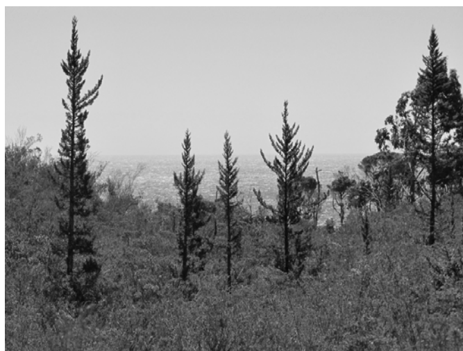
Figura 2. Fotografía de la población de P. uviferum en "Escuela Huiro", comuna de Corral, cercano al Océano Pacífico.